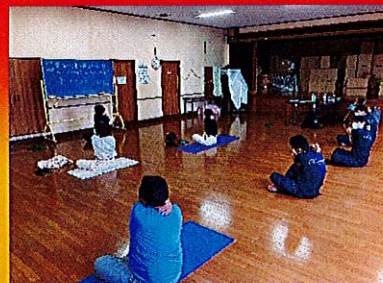
毎回恒例のヨガからスタート

今回、研修のお題は『PR動画の制作』です。来年度以降も新卒採用は継続されますので、学生さん達へ説明会などで上映する動画を、現役の学生さん目線で作ってもらうことが目的です。この日から本格的に企画をし始めたのですが、さすがは現役の大学生！我々の想定を上回るペースで作業は進み、次回からは撮影に入っていきます。もし撮影を依頼されましたら是非ご協力をお願いいたします！！