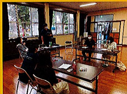
動画制作は北野がリーダー、仕切りが完璧！