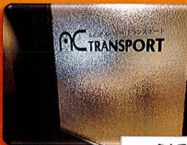
名古屋営業所 事務所