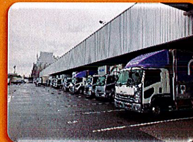
佐川急便名古屋営業所