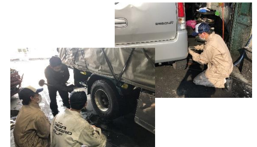
代田橋自動車様での整備実習4/6～